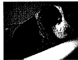
Nova Lei para Protecção dos Animais em Portugal