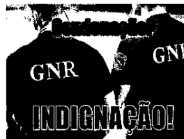
Militar da GNR condenado a 9 anos de prisão!