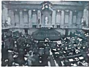
Redução do Número de Deputados na Assembleia de 230 para 180.