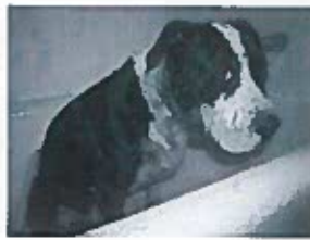
Nova Lei para Protecção dos Animais em Portugal