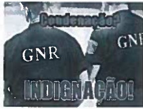
Militar da GNR condenado a 9 anos de prisão!