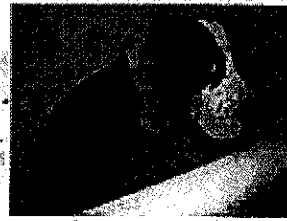
Nova Lei para Protecção dos Animais em Portugal