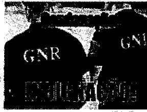
Militar da GNR condenado a 9 anos de prisão!